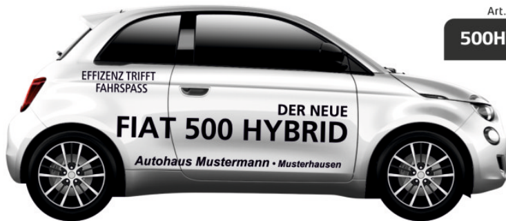
Art. Nr.: 500HY-ECO