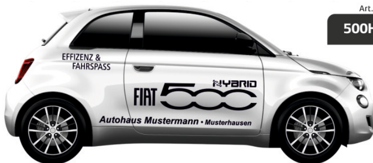
Art. Nr.: 500HY-02