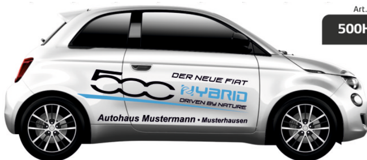
Art. Nr.: 500HY-01