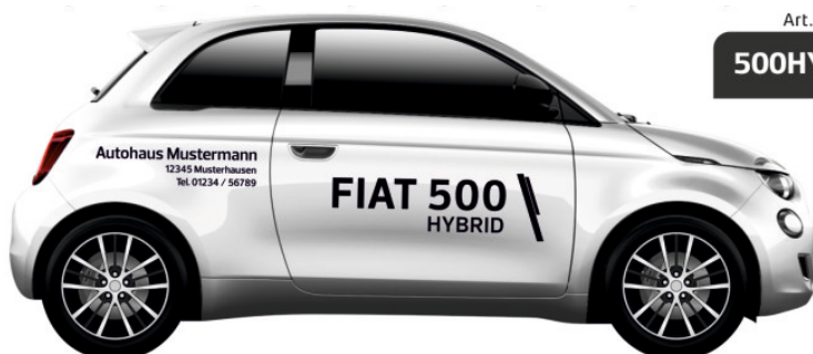
Art. Nr.: 500HY-MINI